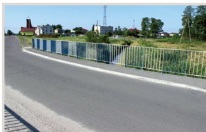
Most na rzece Świnka w pobliżu, którego rozebrała się bitwa w 1920 r.