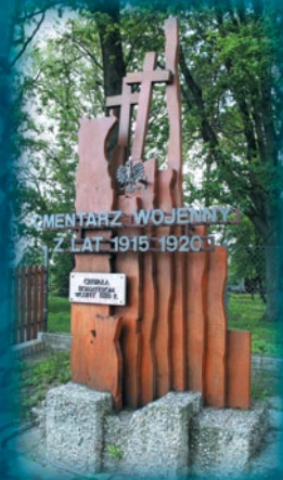
Cmentarz wojenny z lat 1915–1920