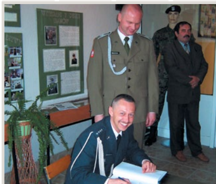
Wizyta oficerów 7 Dywizjonu Ułanów Lubelskich