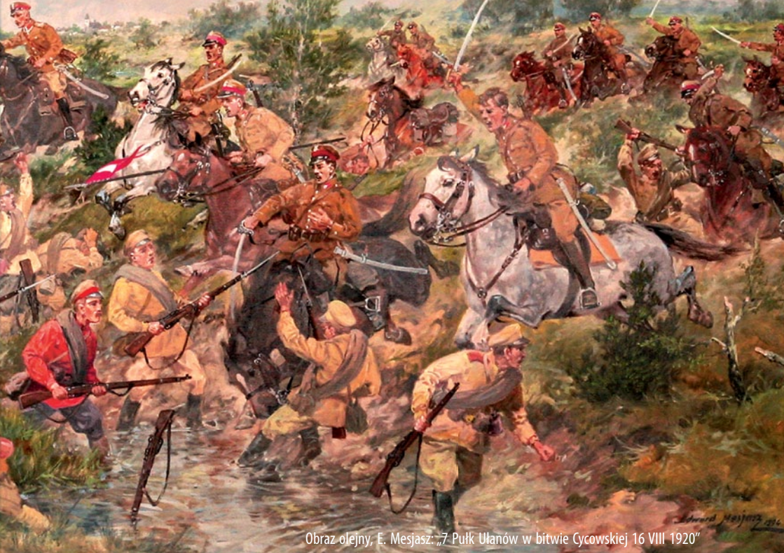
Obraz olejny, E. Masjasz: „7 Pułk Ułanów w bitwie Cycowskiej 16 VIII 1920”