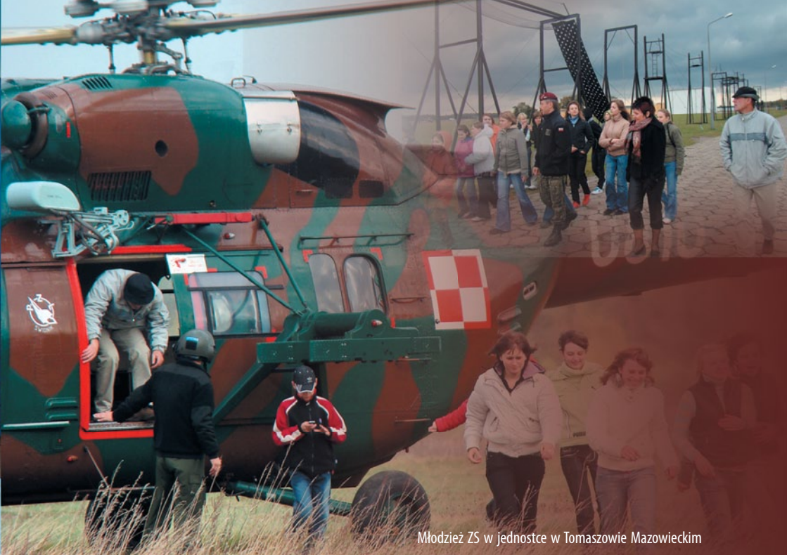
Młodzież ZS w jednostce w Tomaszowie Mazowieckim

Głównym celem pracy nad przyjęciem za Patrona 7 PUL było przywrócenie Cycowowi chlubnej karty w ojczystej historii, upamiętnienie bitwy z 1920 r. z bolszewikami i poległych tutaj ułanów, a także kształtowanie postaw patriotycznych wśród młodzieży.