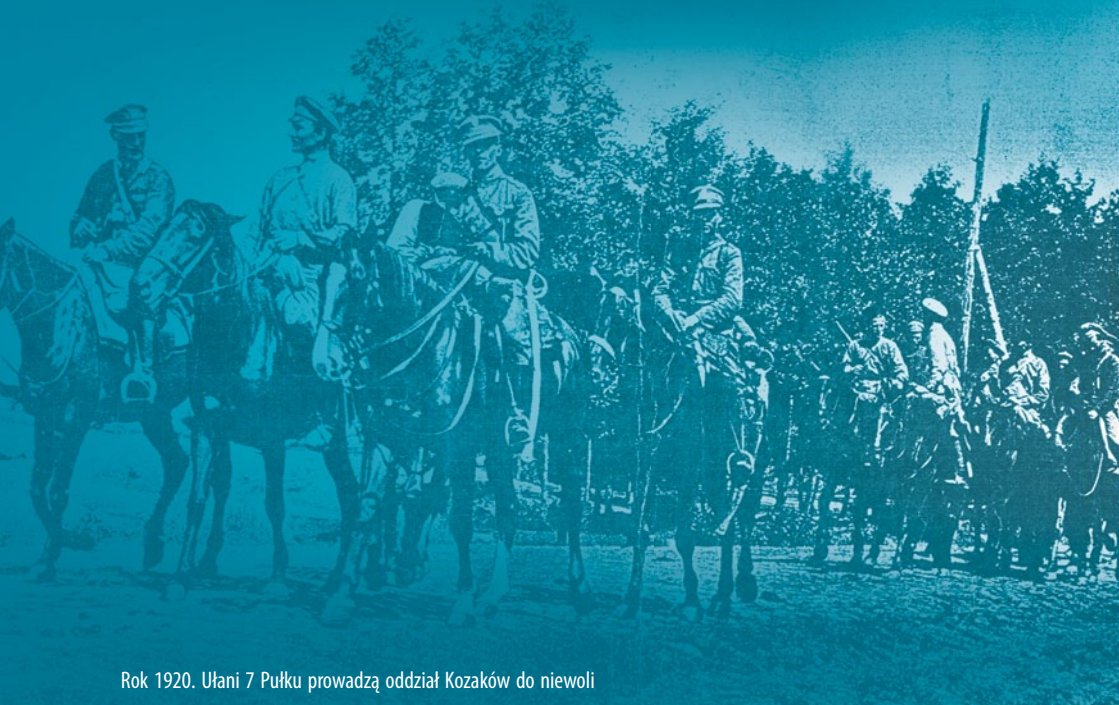
Rok 1920. Ułani 7 Pułku prowadzą oddział Kozaków do niewoli