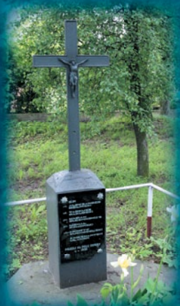
Mogiła ułanów poległych w bitwie na cmentarzu wojennym w Cycowie