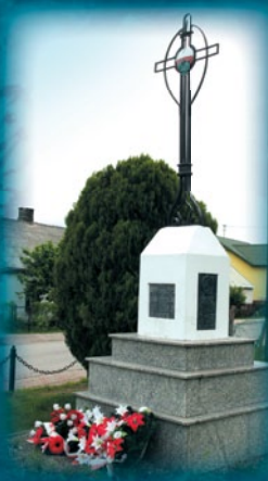
Pomnik ku czci poległych w wojnie 1920 r.

Zajchowskiego: „Uderzyć głównymi siłami, 3 Pułkiem Ułanów i dwoma batalionami piechoty, wspartymi artylerią, od południa, wzdłuż szosy Trawniki – Cyców, skierować 7 Pułk Ułanów do pomocniczej akcji oskrzydającej, wzdłuż rzeki Świnka z kierunku Bekiesza”.